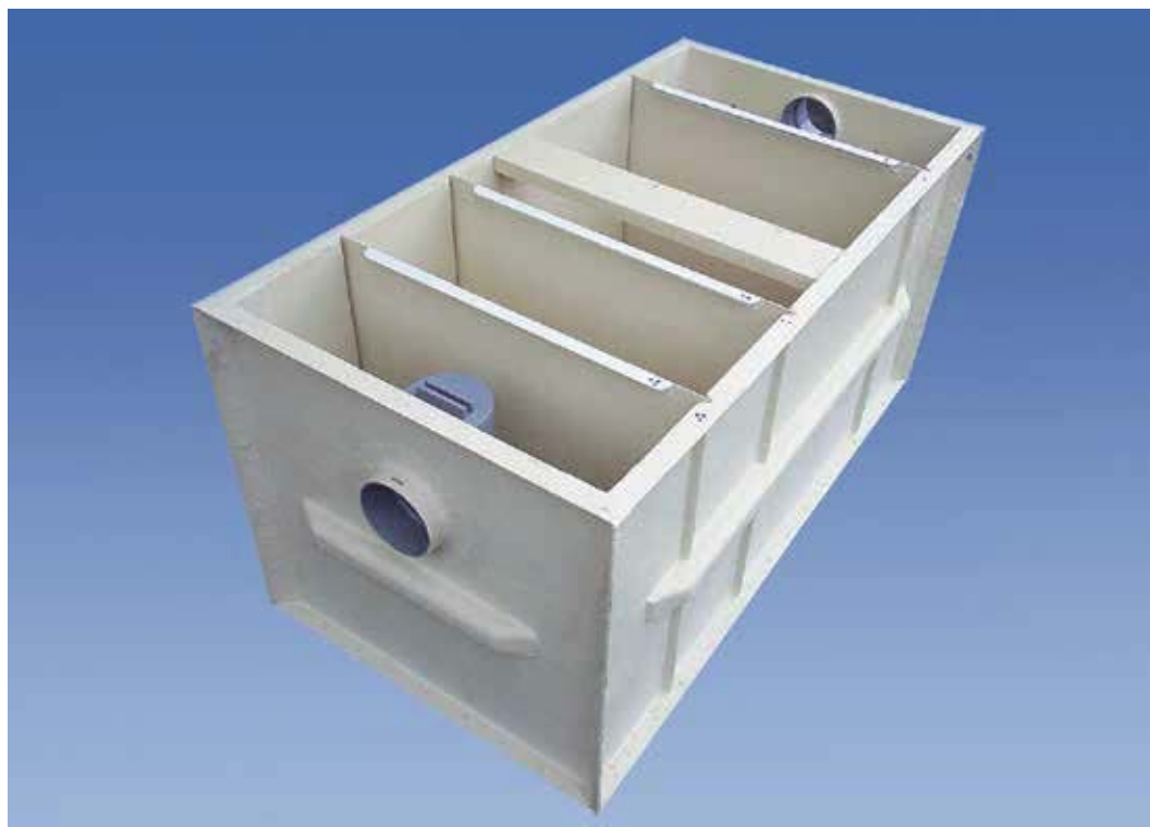
FRP製 大型グリーストラップ JP-GR型 (P31 ~ P33を御参照下さい。)

*JP-G-1050HとJP-G-1260Hは整流板が3枚、JP-G-1470Hは整流板が4枚になります。