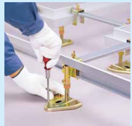
④高さ及び傾きを調整し、オールアンカーで固定する。