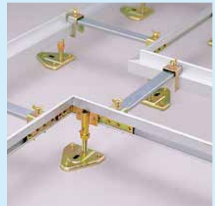
②コーナー部の束は隅に寄せて取り付ける。