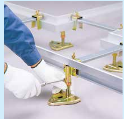
①ツカをセットする。