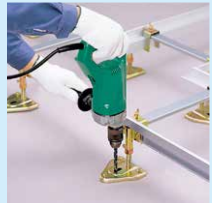
③ドリルにより、固定用穴をあける。