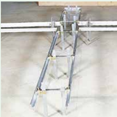
②レベル墨に合わせながら枠組作業。