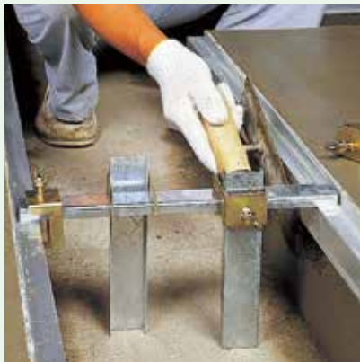
⑥内部モルタル仕上げの時ビットレベルをはずしてください。