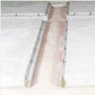
①差筋(9mm程度を約500mm間隔でセット、通り墨出し、レベル墨は100mm逃げ墨とし、溝両サイドに要す。