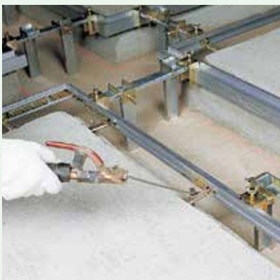
④アンカー溶接で固定する。