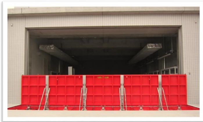
電動起伏式防水板